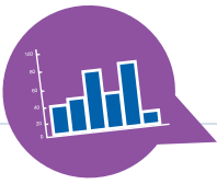
tableau de bord du vétérinaire chef d'entreprise