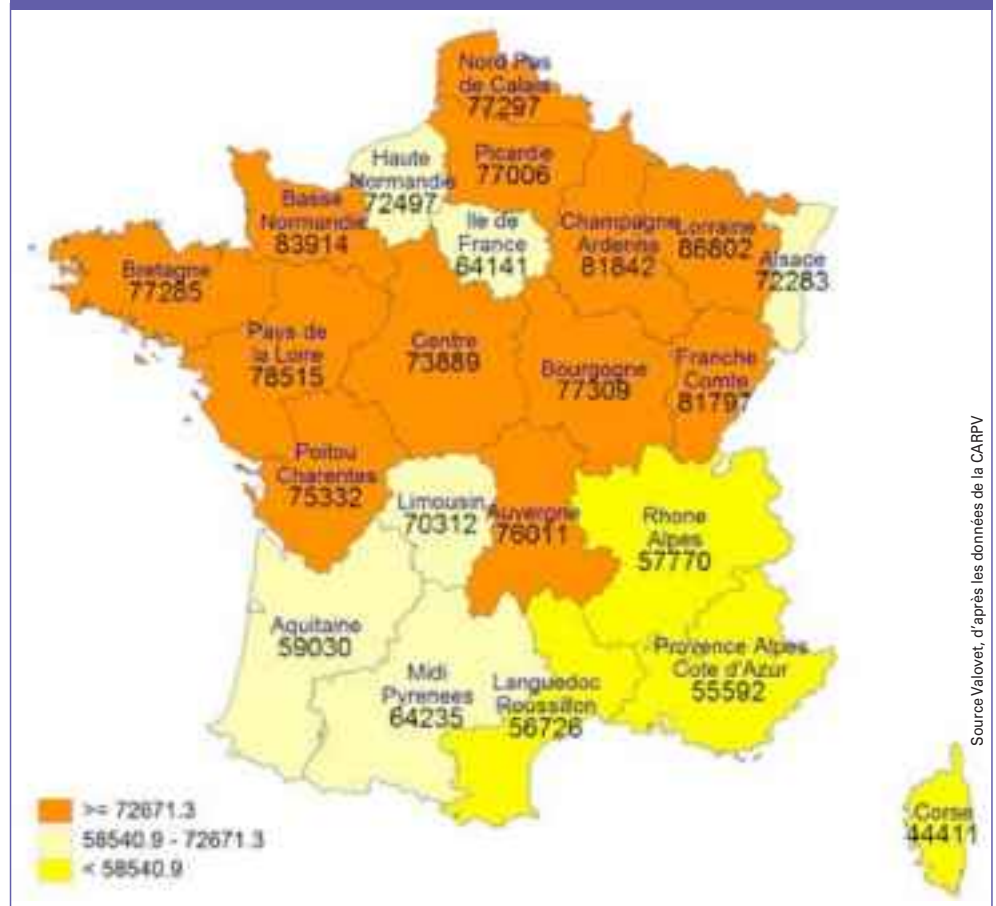
Répartition géographique des revenus 2011